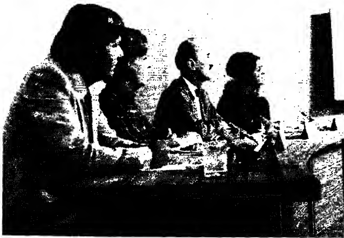
„Was bin ich?“ - Guido Baumann, Annette von Arelin, Hans Sachs und Marianne Koch entschüsseln die „mysteriösesten“ Handbewegungen und tasten sich an die Antwort auf die bereits zur Fernseh-Legende gewordene Frage heraus.

Von Anfang an dabei (1): Robert Lembke, Struppi und ein Finanzminister